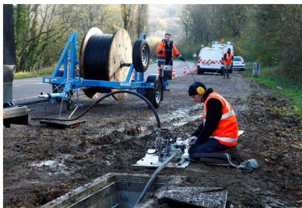
Tirage fibre optique

Avec le déploiement des usages (objets connectés, télétravail, télémédecine, e-administration...), les besoins en débit Internet explosent. Les nouveaux réseaux en fibre optique permettent d'accéder à Internet avec une qualité exceptionnelle et une connexion 1000 fois plus rapide que l'ADSL. Ils permettent aussi l'émergence de nouveaux services, à la maison et au bureau, pour les loisirs, la santé, l'enseignement... De quoi révolutionner les modes de vie !